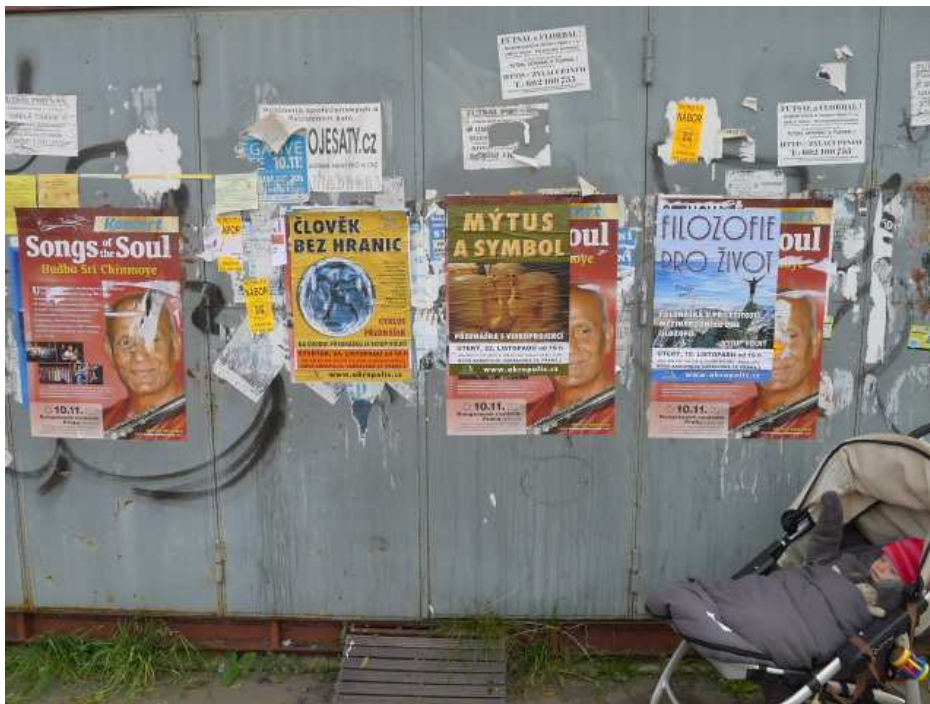
Obrázek č.2 Plakáty nabízející pochybné semináře (Nová Akropolis)

Dále se můžeme setkat se skupinami, jež se nazývají „filozofickými školami“ a nabízí „filozofii pro život“. V současném světě, v němž se tolik pochybuje o dobré vůli lidí, je těžké věřit v poctivost těchto skupin, a též v existenci čistých a poctivých lidí, zbavených postranních