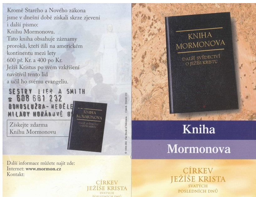
Obrázek č. 5 Letáček s kontakty (Církev Ježíše Krista Svatých posledních dnů/Mormoni)

Sekty jsou pro každého při vstupu otevřené. Psycholog Kurt Lewin popisuje změnu ve třech etapách, kterými si projde jedinec. Je to rozmrazení, změna a zmrazení. Rozmrazení je etapa, která souvisí se vstupem a překonáním netečnosti. Stávající pravidla, zvyklosti a způsoby myšlení jsou rozvolněny. Člověk se pomalu oprostí od původního života a přátel, tzv. opuštění