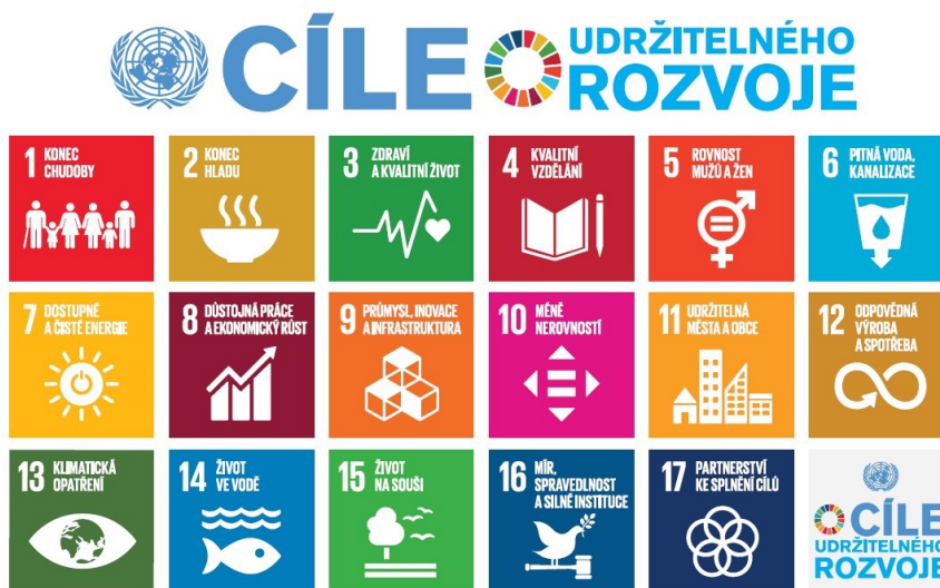
Obrázek 3 Hlavní cíle udržitelného rozvoje, Zdroj: Týden udržitelnosti, © 2023

Je důležité chápat, že sociální, environmentální a ekonomické pilíře společnosti jsou vzájemně propojené a nelze upřednostnit jeden z nich na úkor ostatních. Udržitelný rozvoj se dnes nevztahuje pouze na ochranu přírody a životního prostředí, ale také na efektivní správu a vládnutí. Pro dosažení skutečného udržitelného rozvoje je důležité vytvářet soudržné veřejné politiky, které jsou podloženy fakty a zahrnují účast veřejnosti a smysluplný společenský dialog. (Ministerstvo životního prostředí, © 2008–2023)