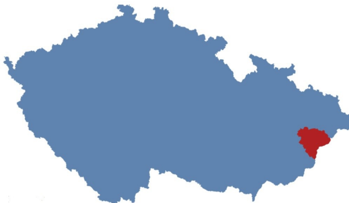
Obrázek 5 Poloha okresu Vsetín na mapě ČR

Okres Vsetín je jedním z okresů nacházejících se ve Zlínském kraji, který byl vytvořen k 1. lednu 2000 jako součást reformy územní samosprávy v České republice, která měla za cíl vytvořit vyšší územní samosprávné celky. Tento kraj je tvořen celkem 14 okresy a zahrnuje i okres Vsetín. Okres Vsetín je charakteristický svým horským a zalesněným terénem. Více než polovina jeho rozlohy je pokryta lesy, což z něj činí jeden z nejlesnatějších okresů v České republice. Nejvyšší horou ve Zlínském kraji je Čertův mlýn, který se nachází v Moravskoslezských Beskydech v severní části okresu. Kromě toho okres Vsetín zahrnuje i další horské pohoří, jako jsou Vizovické vrchy na jihu a výběžky Hostýnských vrchů na západě, které se táhnou dále do Vsetínských vrchů. Dále je také součástí státní hranice se Slovenskem, která se nachází na vrcholech Javorníků. (Český Statistický Úřad, © 2023)