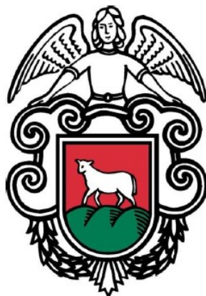
Obrázek 7 Znak města Vsetín, Zdroj: Strategický plán rozvoje města Vsetína 2016-2023, © 2023

Vsetín je městem s bohatou kulturní nabídkou. Každoročně se zde pořádají akce, jako např. Valašské záření, Jazzový festival, MFF Vsetínský krpec atd. Kromě toho je zde Hvězdárna, která nabízí různé programy a akce pro návštěvníky všech věkových kategorií, včetně pozorování Slunce a astronomických pozorování. Dále jsou v okolí i naučné stezky a stezky kolem rybníků. Město je také významným centrem umění a kultury. Mnoho výtvarných umělců se zde narodilo a působilo, a jejich díla zachycují krásy kraje. Soubory valašských písní a tanců zde uchovávají tradice lidové kultury. Vsetín se v průběhu století stal důležitým centrem průmyslu, ekonomiky, kultury a sportu. (Město Vsetín, © 2023)