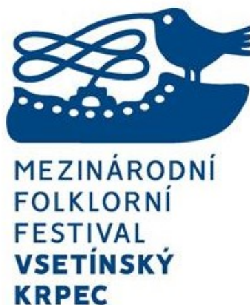
Obrázek 10 Logo festivalu Vsetínský Krpec

Vsetínský krpec je jedinečnou událostí, která nabízí návštěvníkům možnost poznat a vychutnat si autentickou lidovou kulturu z celého světa. Od roku 2000, kdy se festival poprvé uskutečnil, se stal velmi oblíbenou akcí nejen v regionu, ale také mezi turisty z celé České republiky i zahraničí. Tato akce, pořádaná každé dva roky, přináší do města čtyřdenní slavnost folkloru, lidových tradic a umění. Na festivalu se prezentují soubory a cimbálové muziky z celého světa, ať už z Evropy, Asie, Afriky nebo Ameriky. Díky tomu je Vsetínský krpec nejen kulturním zážitkem, ale také cestou poznání a setkávání se s jinými kulturami. Mezi nejvýznamnější programové bloky patří vystoupení jednotlivých souborů, ale i společné komponované programy. Od roku 2014 se festival přestěhoval do krásného prostředí Panské zahrady, což přineslo novou dimenzi spojení folkloru a přírody. Návštěvníci tak mohou využít příjemného a přirozeného okolí a odpočinkové zóny. Kromě bohatého programu na pódii se v Panské zahradě pořádá také lidový jarmark a další aktivity pro návštěvníky. Vsetínský krpec je tak nejen kulturní, ale i společenskou událostí, kterou si může užít celá rodina. (MFF Vsetínský krpec, © 2022)