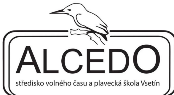
Obrázek 8 Logo ALCEDA Vsetín, Zdroj: ALCEDO, © 2016

ALCEDO je střediskem volného času a plaveckou školou ve městě Vsetín, které patří mezi školská zařízení a je také příspěvkovou organizací s právní subjektivitou od roku 1993. Jeho zřizovatelem je město Vsetín. Zaměřuje na poskytování služeb a partnerství v oblasti vzdělávání a volnočasových aktivit pro děti, mládež, veřejnost a školská zařízení. Většina aktivit tohoto střediska se zaměřuje na lidi, vztahy a přírodu. Tato tři slova nejsou pouze prázdnými frázemi, ale tvoří hlavní zásady, které jsou zahrnuty do všech projektů. Lidé jsou v centru pozornosti, a to nejen klienti, ale i jeho zaměstnanci a partneři. Vztahy znamenají spolupráci a společné úsilí o dosažení společného cíle. Příroda je v ALCEDU vnímána jako neoddelitelná součást našeho života a je tedy důležitá pro zachování kvality života pro nás i pro budoucí generace. (ALCEDO, © 2016)