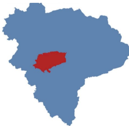
Obrázek 6 Poloha města Vsetín v okrese Vsetín, Zdroj: kurzy.cz, © 2000–2023

zónou, kde najdeme mnoho restaurací, obchodů a budovu nazvanou "Kremel". V této budově se nachází nová městská knihovna a informační centrum. (Město Vsetín, © 2023)