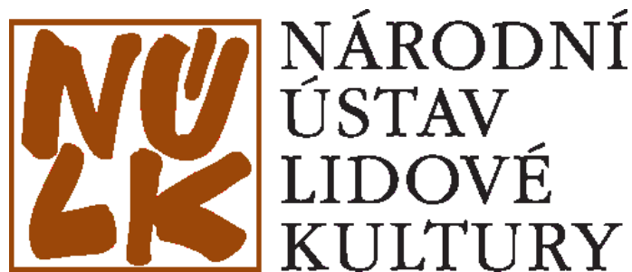
Obrázek 1 Logo NÚLK, Zdroj: Národní ústav lidové kultury, © 2023

V roce 2003 schválila vláda České republiky plán na zlepšení ochrany tradičního lidového kulturního dědictví v zemi, který byl vypracován Národním ústavem lidové kultury a Ministerstvem kultury České republiky ve spolupráci s řadou odborníků z různých institucí a úřadů. Centrálním pověřeným pracovištěm pro koordinaci a plnění úkolů spojených s tímto plánem byl jmenován NÚLK. (Národní ústav lidové kultury, © 2023)